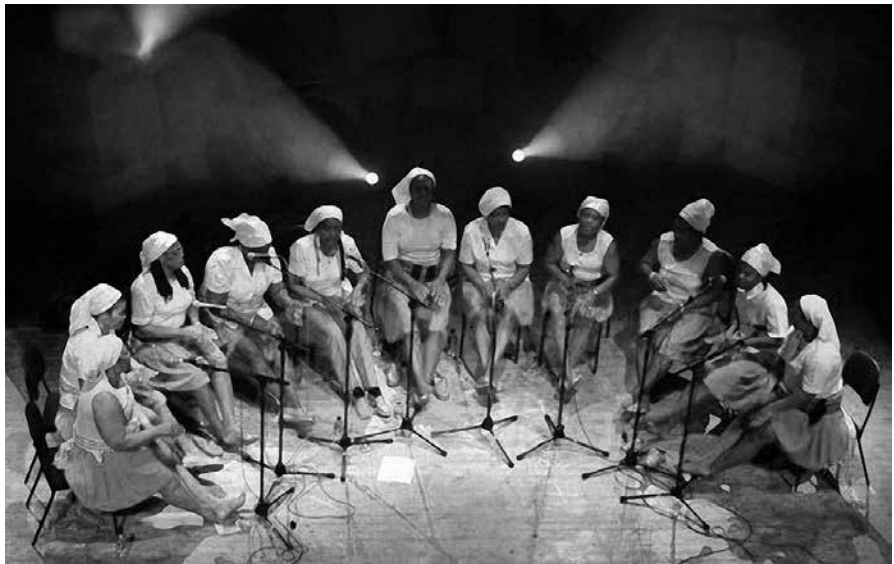
Actuación de Batuko Tabanka

Un dez. Un 100%. Toda a xente, agás ese veciño, o resto un 10. Se me pasa calquera cousa, todo o mundo pregunta: que che pasa? Queres que te levemos a algún sitio? Dígoche e digo sempre que desexaría ter un brazo moito máis longo para xuntar a xente, incluso practicamente España enteira, que por onde fun todo o mundo me quixo ben, para abrazalo. Sempre me levei ben con todos. Teño uns veciños asturianos cos que comparto parede medianeira e fixe-