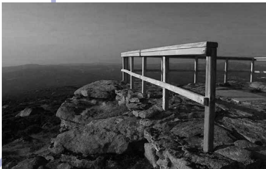
Petróglifo do Outeiro do Coto ao lado do miradoiro obsequio da empresa concessionaria

Amais, a Forcarei incumbe esencialmente o espolio que se leva cometendo coa cachotaría do muro do pasteiro do Seixo. A apertura de pistas, o tránsito indiscriminado de vehículos e a ausencia de gardarías favorecen o roubo reiterado destas pezas.