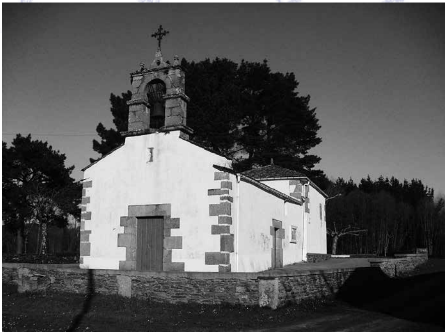
Igrexa de Duarría