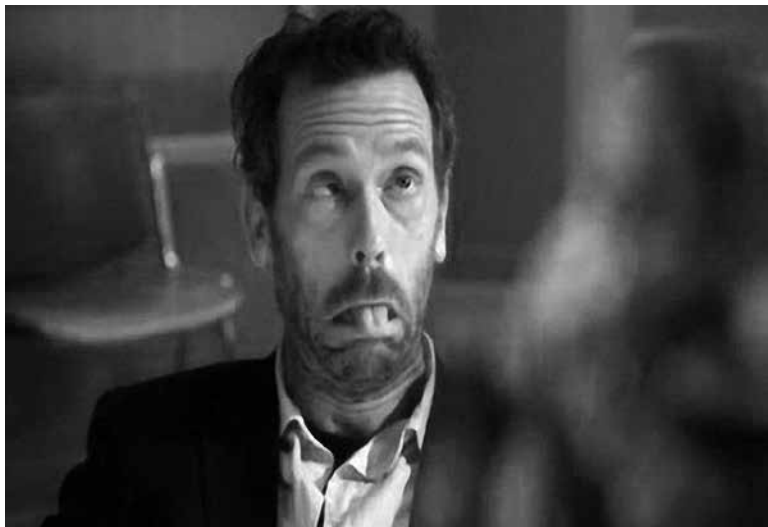
Fixo un ricto diante daquel rito

O outro día démoslles un repaso a esas palabras que mudaron a súa ortografía a partir de 2003. Antes mantiñan o grupo culto (ct ou cc) igual ca en castelán e agora non o teñen. Lembrades termos tan comúns como vitoria , vítima , condutor , dicionario ...? Seguramente agora xa escribides ben produto e redución , pero non vaiades confundirvos e “pasarvos de freada”. Lembrade que estes grupos cultos perden o C, só diante de I e U. Isto quere dicir que palabras