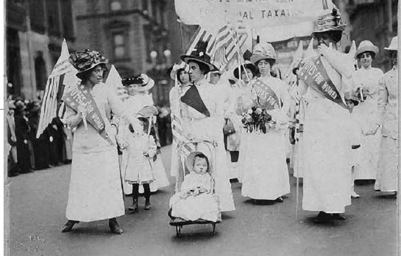
Manifestación sufragista en Nova Iorque (1912)

O Feminismo ten como obxectivo poñer de manifesto que o rol social asignado ás mulleres non ten orixe natural nin divino, senón social. É a sociedade patriarcal a que elabora o discurso da discriminación de xénero. O feminismo critica as construcións teóricas nas que se apoia e fai emerxer da historia as voces silenciadas que defenderon a igualdade.