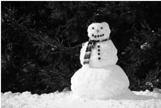
Este boneco non ten unha bufanda moi acaída...