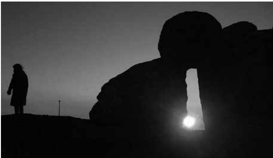
A porta do outro mundo, na montaña máxica do Seixo, onde patrulla a xente de Capitán Gosende

Irimia é moito mais que o número de socios e socias ou subscritores da revista. Cada unha de nós representa a moitas e moitos mais, podendo chegar a miles de persoas. Hai tres anos que vos coñecín, que atopei outra forma de ver as cousas. Descubrín que os irimegos e irimegas son unha parte fundamental nese “cambio dende abaixo” que está a ocorrer nos nosos días. Dádesme forzas e inspiración. Grazas.