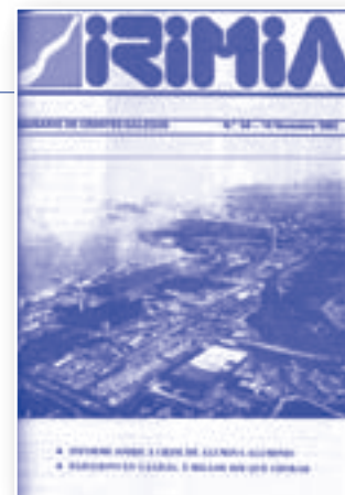
De “Terra e xente”. Irimia nº 56 (28 de novembro de 1982)

Convén tamén ter en conta que por riba da súa xordeira, o xordo é unha persoa, e debe ser tratada con normalidade.