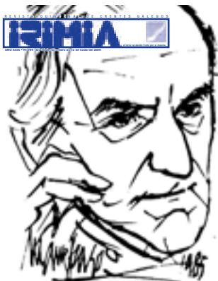
Elacuría: 20 anos de presenza

Se queres podes ingresar directamente en calquera das nosas contas indicando claramente o teu nome no impreso de ingreso e enviándonos unha copia xunto cos teus datos. Conta: CAIXA GALICIA: 2091-0349-45-3040005822 BBVA 0182-0267-15-0207905484