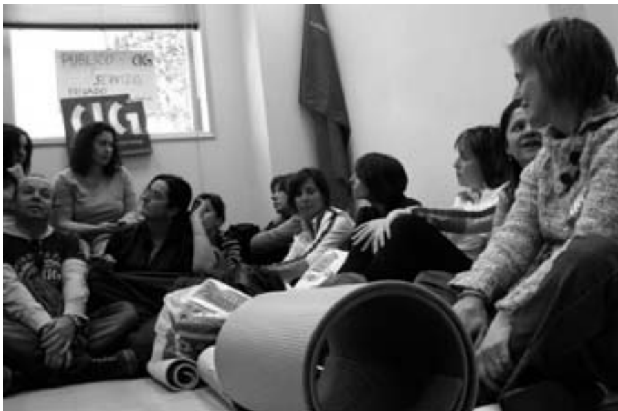
Traballadoras e traballadores do Consorcio nun acto de protesta.

Sabemos ben que a situación é de crise e que cómpre usar con mesura os cartos públicos. Admitamos que en época de bipartito houbo moito de bigoberno e de competición, moi machista ela, por ver quen a tiña máis grande diante do electorado –a capacidade de gasto, quero dicir. Concluamos que ir de farol non é nada exemplar e que son, estes, tempos de menos alegrías orzamentarias e de contención.