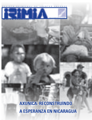
AXUNICA: RECONSTRUÍNDO A ESPERANZA EN NICARAGUA

Conta: CAIXA GALICIA: 2091-0349-45-3040005822 BBVA 0182-0267-15-0207905484